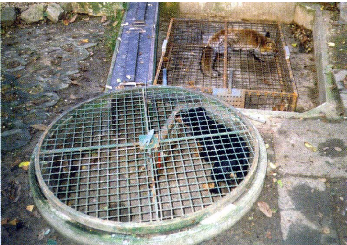
Čist posao – lisica je skočila iz kotla i uskočila u drugi kavez