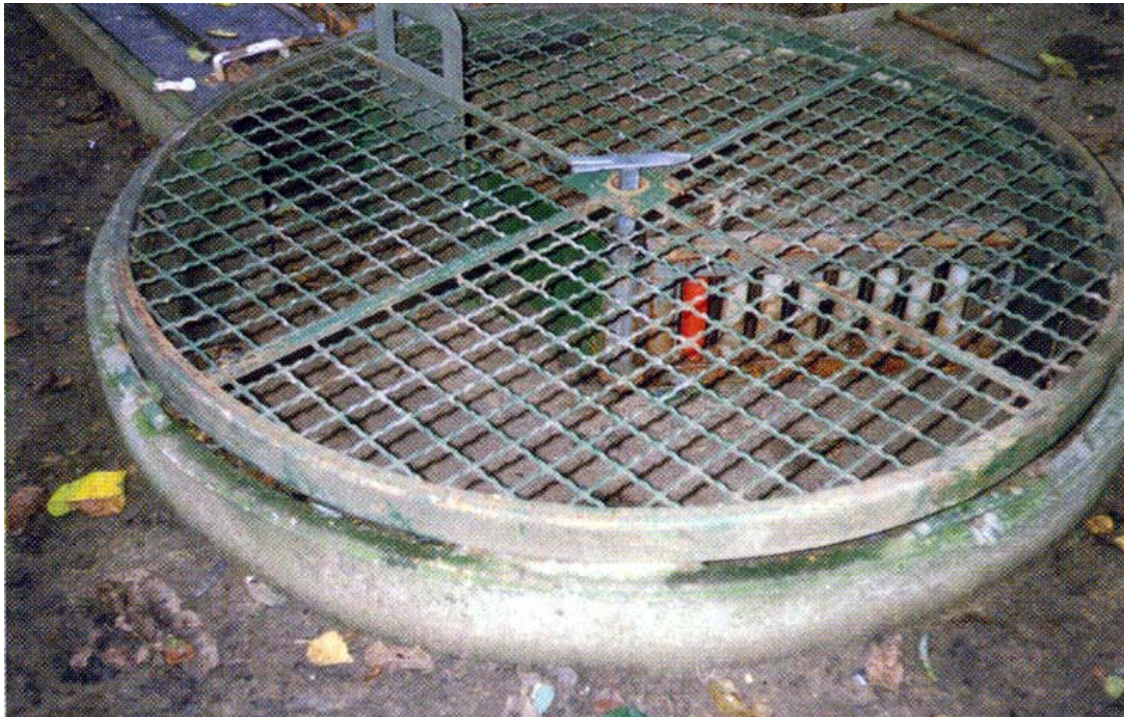
Okrugli kotao je još prazan