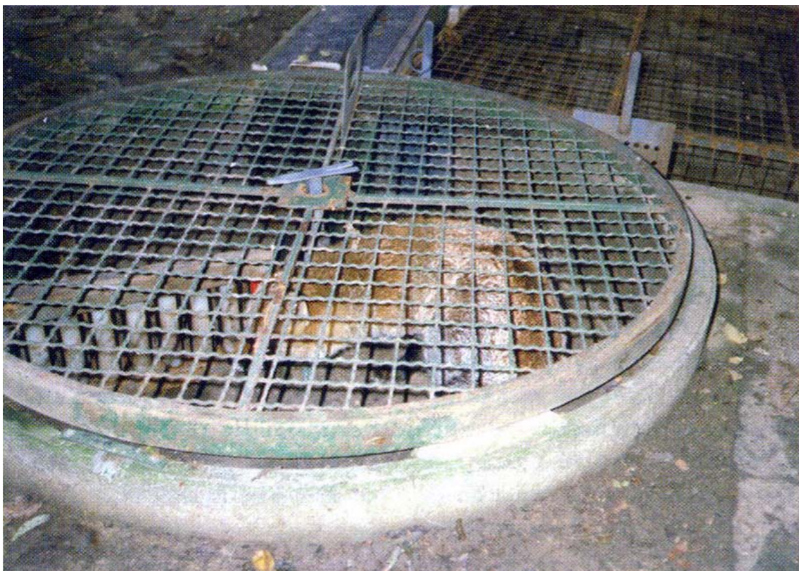
Lisica je ušla u kotao