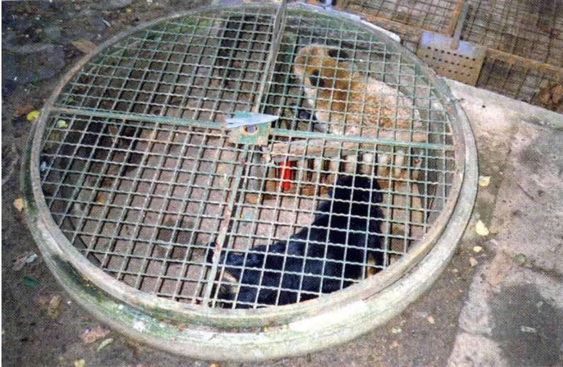
Pas je naknadno uvučen u okrugli kotao i sada je čvrsto usmeren na lisicu koja je već u kotlu